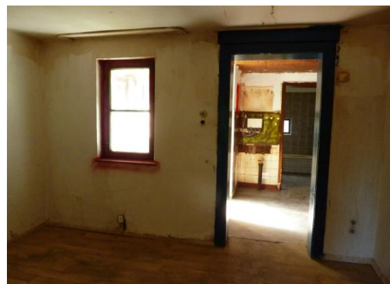
Blick WZ in die Küche