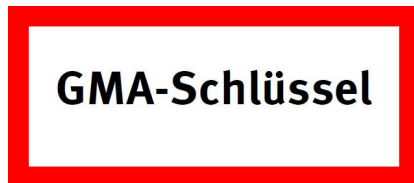
Abbildung 3 Schild nach DIN 4066