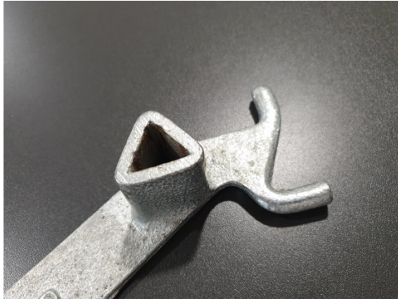
Abbildung 1 Dreikantschlüssel

Feuerwehzufahrten gemäß §5 BauO NRW dürfen nicht eingeeengt und müssen jederzeit freigehalten werden. Ein Versperren der Zufahrt durch ein Tor oder mittels Pfosten ist nur dann statthaft, wenn das Tor mittels Schlüssel A für Überflurhydranten nach DIN 3223 (Abb. 1) geöffnet werden kann.