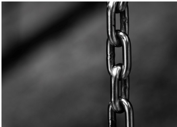
Abbildung 2 Kette

Alternativ kann die Toranlage mit einer Sicherungskette und einem Bügelschloss (Bügel- bzw. Kettenstärke max. 6 mm, ungehärteter Stahl) gesichert sein.