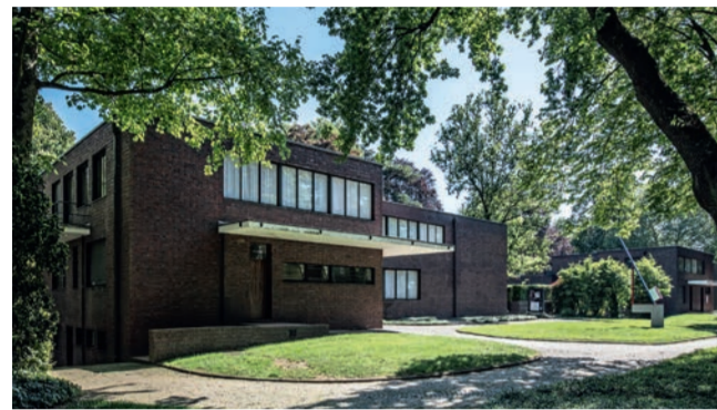
Museen Haus Lange und Haus Esters

Das Villenensemble Haus Lange Haus Esters zählt zu den architektonischen Glanzlichtern des Neuen Bauens in Deutschland und vermittelt noch heute auf beeindruckende Weise ein funktionales und zugleich naturbezogenes Wohnkonzept. Beim Haus Lange sind alle südlich orientierten Fenster im Erdgeschoss als ungeteilte Glasflächen ausgebildet und können in den Keller abgesehen werden. Dadurch kann die Trennung von Innen- und Außenraum vorübergehend nahezu aufgelöst werden. Die von Ludwig Mies van der Rohe erbauten Häuser sind heute international bekannte Museen für zeitgenössische Kunst.