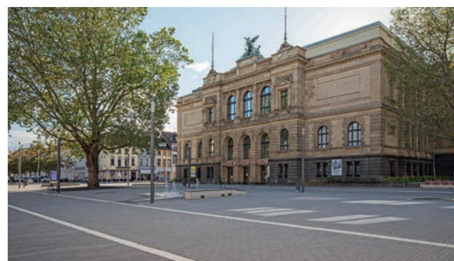
Kaiser Wilhelm Museum

Der Bau mit formalem Bezug zur Palastarchitektur der italienischen Renaissance beherbergt heute eine bedeutende Kunstsammlung aus der zweiten Hälfte des 20. Jahrhunderts. Gemeinsam mit den Mies-van-der-Rohe-Bauten (Häuser Lange und Esters) bietet es ein facettenreiches Forum für die Gegenwartskunst. In den Jahren 2011–2015 wurde das Museum nach den Plänen des Architekturbüros Wilfried Brenne instand gesetzt und modernisiert.