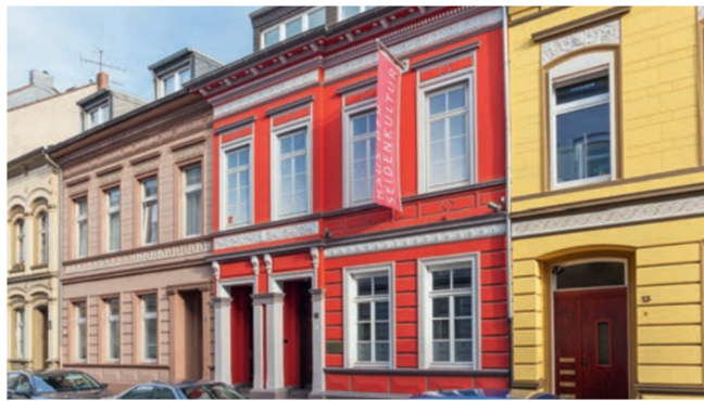
Haus der Seidenkultur

Die ehemalige »Paramentenweberei Hubert Gotzes«, das heutige »Haus der Seidenkultur«, wird von einem Förderverein als »lebendiges Museum« geführt. Es ist im zurückhaltenden Historismus mit floralen Motiven in den Friesen der Gesimse erbaut. Einzigartig ist der vollständig erhaltene Websaal, in dem altes Handwerk präsentiert wird.