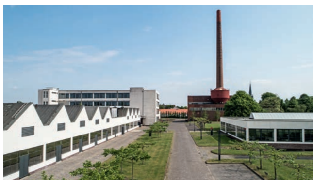
Mies van der Rohe Business Park

Ludwig Mies van der Rohe erhält in den 20er Jahren den Auftrag, das Büro und das Versandhaus der Versandtag zu entwerfen. Ein Büro- und Lagerkomplex mit vier Etagen wird flankiert von einer Halle aus acht Sheds. Mies führt den schlichten kubischen Bau des Färberei- und HE-Gebäudes mit weißer Putzfassade und regelmäßiger Fenstergliederung aus. Seine Längsseite wird allein durch die Fallrohre gegliedert. Besondere Aufmerksamkeit erfährt die Gestaltung des Haupttreppenhauses, das vollständig mit Bockhorner Klinker verkleidet ist. Heute befindet sich auf dem Gelände der Mies van der Rohe Businesspark.