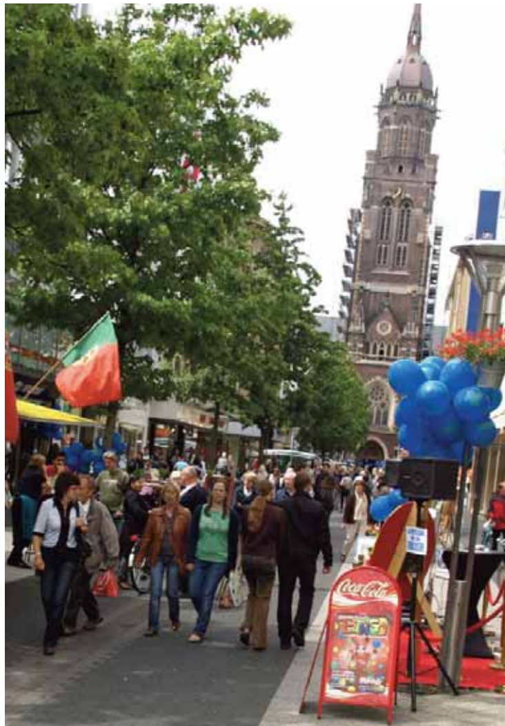
„Kultur findet Stadt(t)“ in Krefeld.