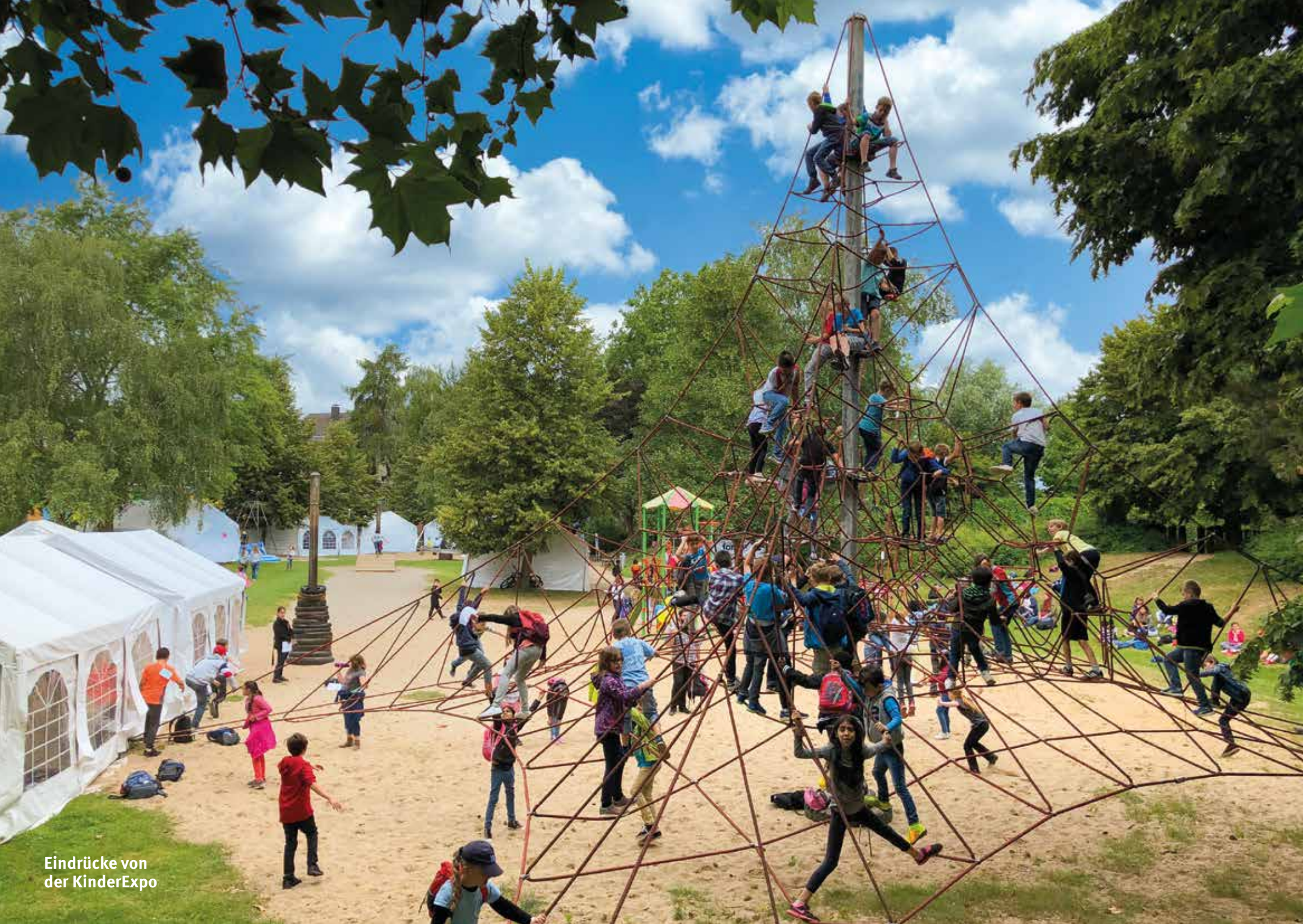
Eindrücke von der KinderExpo